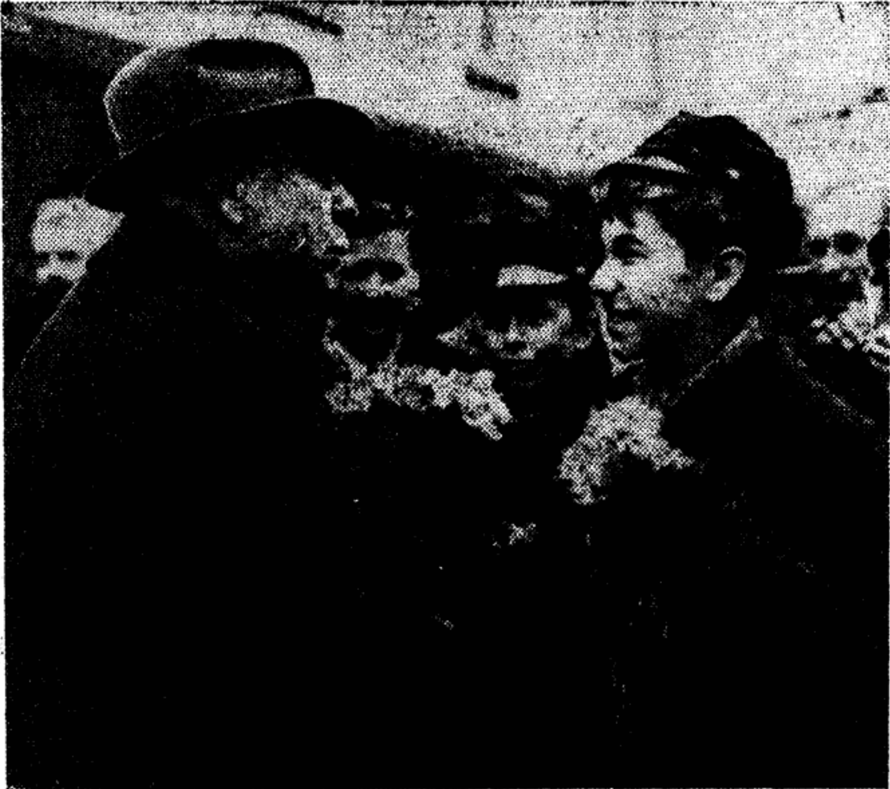
К. Е. Ворошилов беседует с юными горожанами в г. Катовице.

ГОСТЬ Польши Климент Ворошилов, как обычно, начинает свой трудовой день в пять часов утра. Еще в Варшаве, на автобусной прогулке по улицам, оживившись беседами с рабочими и служащими, которые встречались ему на пути. Председатель Президиума Верховного Совета СССР неизменно удивляет своей неутомимостью всех поляков.