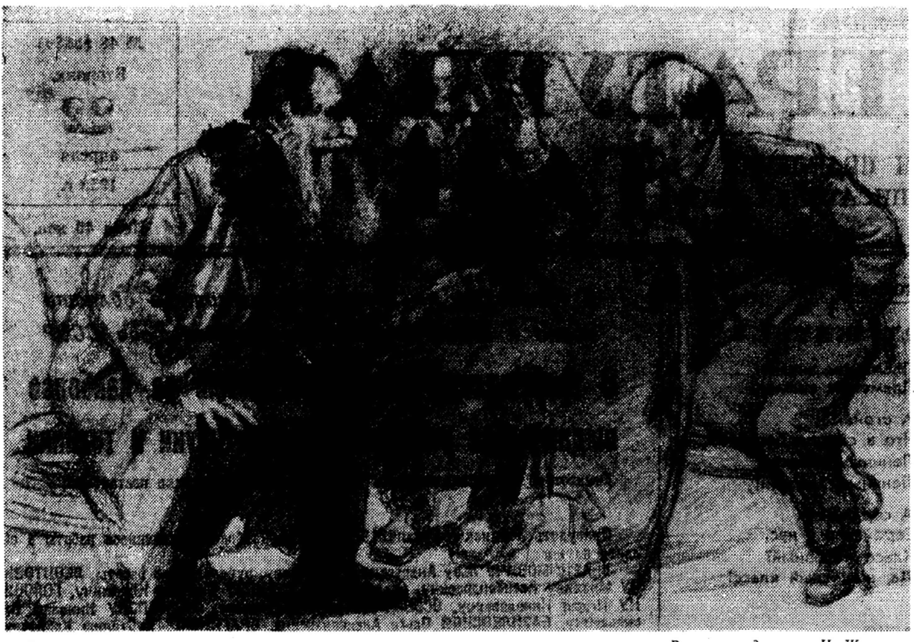
Разговор по душам

Александр СМЕРДОВ, собственный корреспондент «Литературной Газеты»